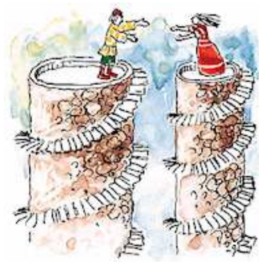
Abbildung 1: Skizze zur Aufgabenstellung

Zwei kreisrunde Türme mit der gleichen Höhe haben unterschiedliche Durchmesser. Eine spiralförmige Treppe windet sich um jeden der Türme vom Boden bis zur Spitze. Der Anstieg beider Treppen ist gleich und konstant. Welche der Treppen ist länger?